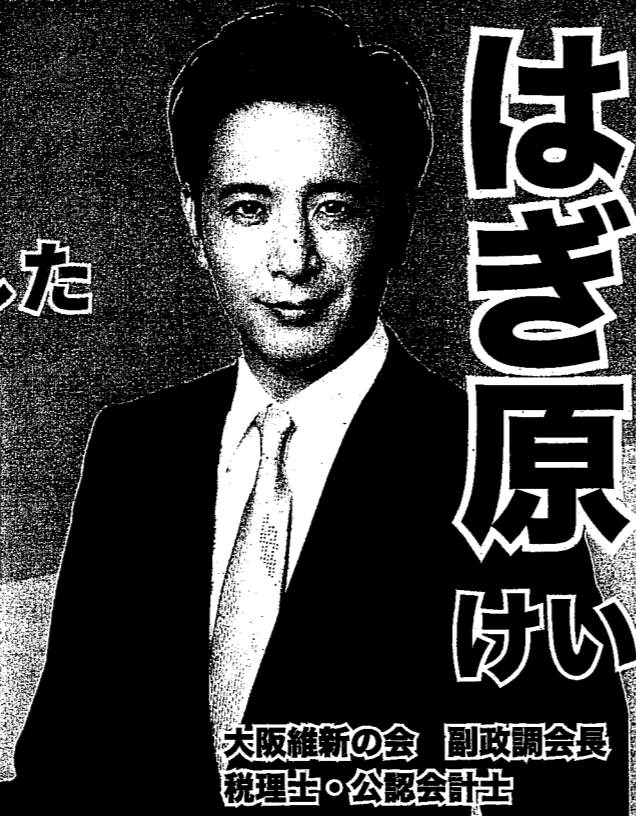
大阪維新の会 副政調会長 税理士・公認会計士

本会議では、2023年1月又は2月検針分の水道料金の基本料金の免除（2か月分）等の7億5,480万円の補正予算等が上程され、議論・議決が行われました。本会議2日目の終了時刻は21時半を超え、私が議員になって最も長時間の議会となりました。その他、今回の議会では「茨木市中学校給食センター整備・運用事業における契約締結について」も上程され、いよいよ全員喫食の中学校給食実施に向け給食センターの建設・運営に関する事業も決定しました。そこで、今回の市政報告では茨木市の中学校給食についてよくある質問と回答を紹介します。