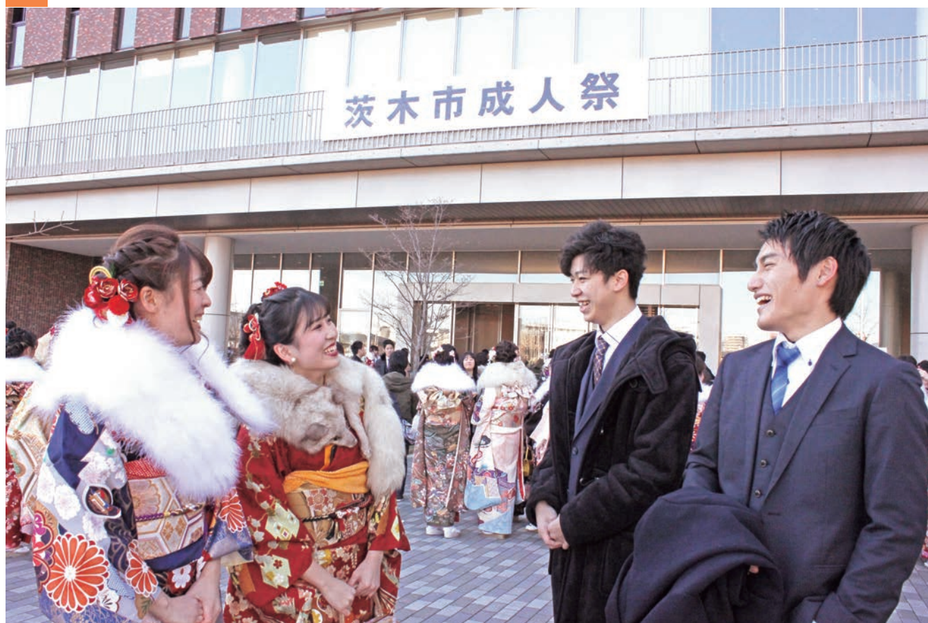
第 71 回茨木市成人祭 (立命館いばらきフューチャープラザ)