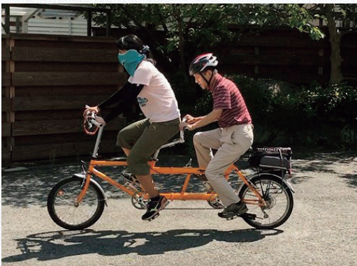
市内 NPO により開催されたタンDEM自転車体験会

視覚障害者を後ろに乗せて走るタンDEM自転車が目立っており、当事者からも、自転車が移動手段に加われば行動範囲が広がり、とても便利になるという声がある。大阪府内では2016年8月から走行可能であるが、歩道を走ることができず、許可