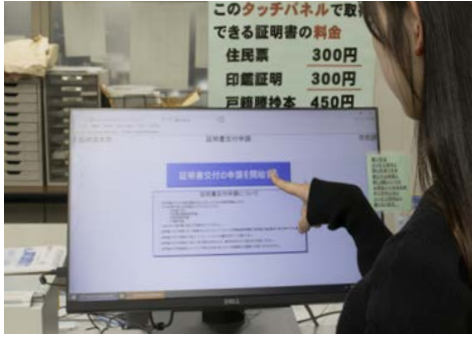
窓口申請ツール ※窓口料金と同額 (市役所本館 1階市民課窓口横)