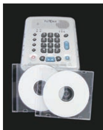
ダイジー図書再生機器（イメージ）