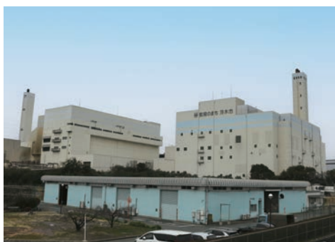
ごみ処理施設 環境衛生センター (東野々宮町)

答 国は、持続可能なごみの適正な処理を確保するための方策の一つとして、広域化や集約化を推進している。本市としても、今後の社会情勢の変化やごみ処理の現状を踏まえつつ、ごみ焼却方式や広域化を含め検討を進める必要があると考えている。