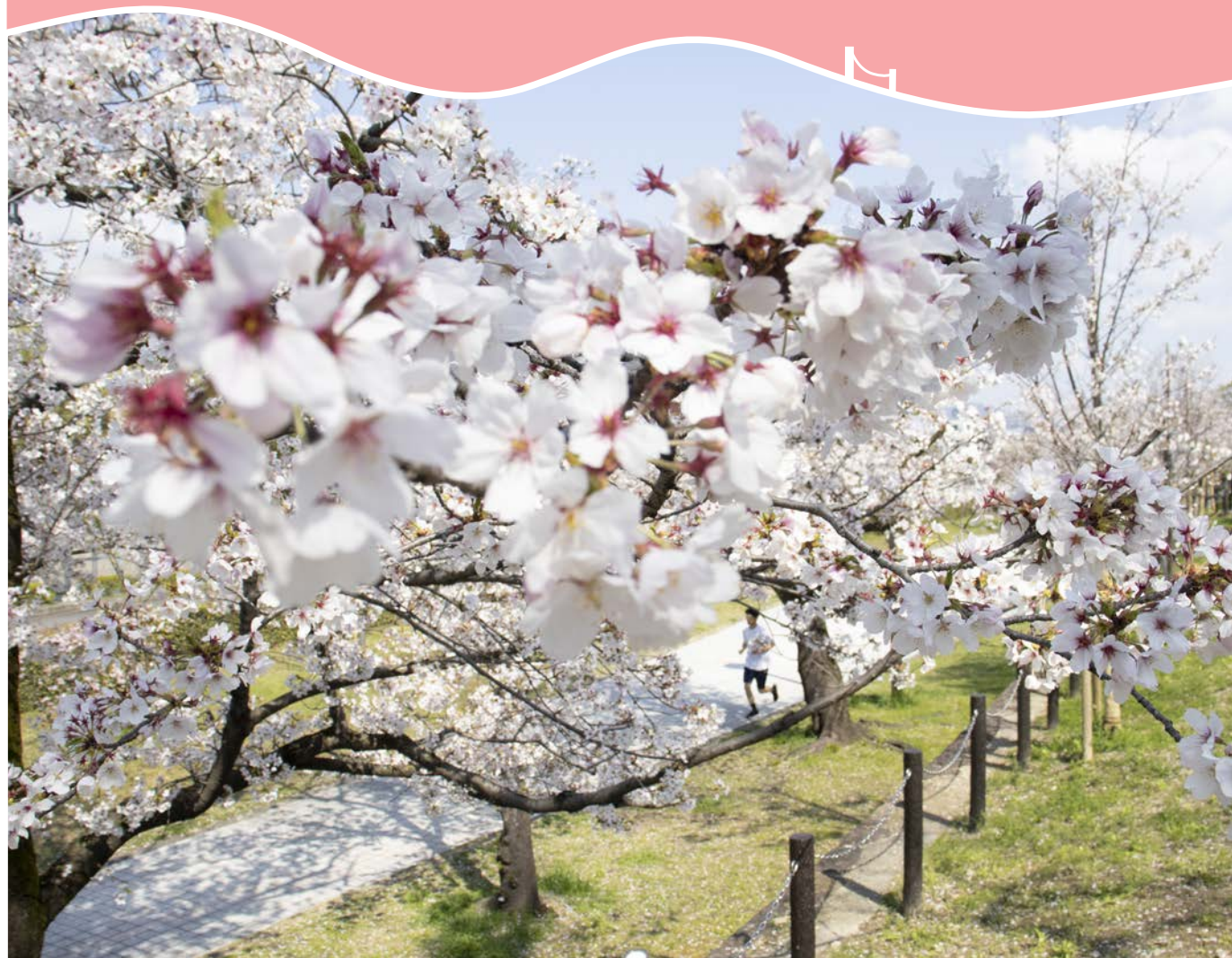
元茨木川緑地の桜並木【撮影日 令和8年4月2日】