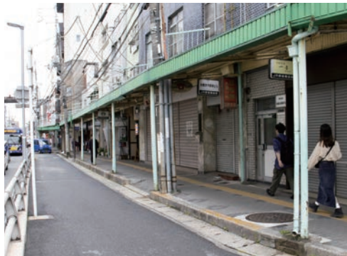
中央通り（JR 茨木駅前商店街前側道）

答 現在は、専用の相談窓口は設けていないが、不登校の子どもたちのために居場所の立ち上げを考えている方が希望される場合には、教育委員会で内容を伺いたいと考えている。伺った内容については、市長部局とも共有するなど、連携を進めていきたい。