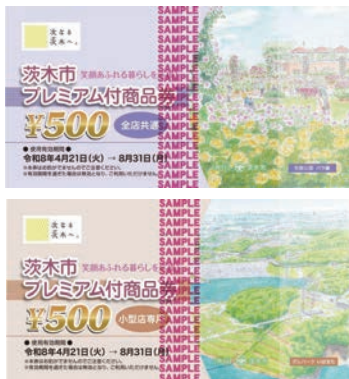
令和8年度茨木市プレミアム付商品券

答 物価高騰の長期化等を取り巻く社会環境に対応するため、国・府も含め、これまでからさまざまな施策を講じてきている。今後、物価高騰の状況の変化を注視していく中で、その時々状況に応じて、効果的な施策を検討していく。