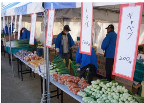
農業祭での茨木産野菜販売 (中央公園グラウンド)

学校給食へ地元産の米や野菜を供給しているほか、農産物や加工品を販売するマルシェ等の開催に取り組んでいる。また、地元産の農産物の取扱いを希望する店舗と生産者とのマッチングなども実施している。