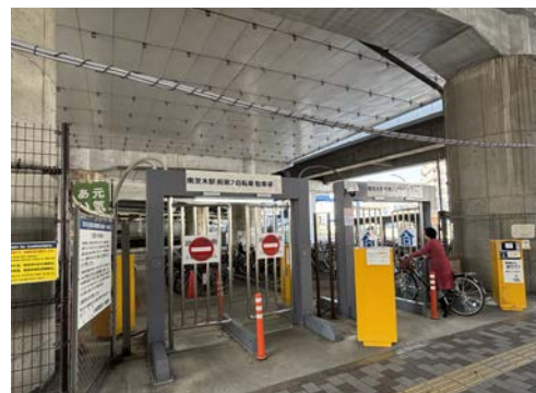
南茨木駅前第2自転車駐車場(東奈良三丁目)