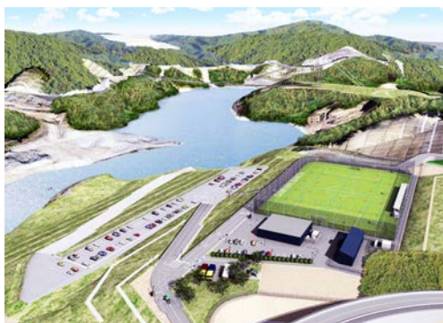
ダムパークいばきた多目的運動広場イメージ

り、そのための丁寧な意見交換が必要と考えている。地区ごとの取組状況は適宜共有しており、地区間の連携の可能性も探りながら、引き続き地域の皆さまと検討を進めていく。