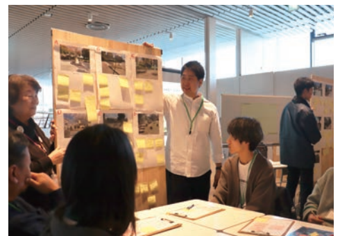
みんなの公園アイデア&やってみるワークショップ（令和6年12月実施）

問 地域住民や事業者などと連携し、公園の利活用を促進する「みんな育てる公園プロジェクト」の仕組みづくりに取り組んでいくとのことである。これまでの取り組みで得た課題と今後の方向性は。