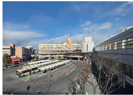
阪急茨木市駅前（西口）

し、公益施設を所有・運営する予定はないが、魅力ある駅前づくりに向け、公益的な機能の導入に限らず、協力し検討していく。