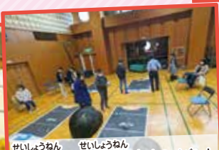
せいしやうねん せいしやうねん 青少年による青少年のためのイベント