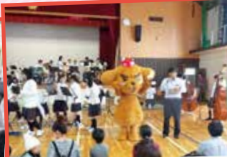
せいしやうねんけんぜんいくせいたいがい 青少年健全育成大会