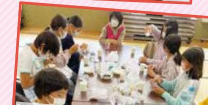
しやうがっこう かいいくせいれんらくきやうきやうかい ぎやうじ 小学校区こども会育成連絡協議会の行事