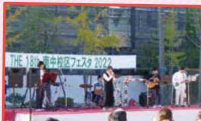
ちゅうがっこうせいしやうねんけんぜんいくせいしやうけんどうきやうかい ぎやうじ 中学校区青少年健全育成運動協議会の行事