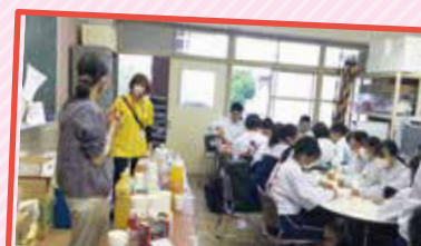
ちゅうがっこうせいしやうねんしどういんかい ぎやうじ 中学校区青少年指導員会の行事