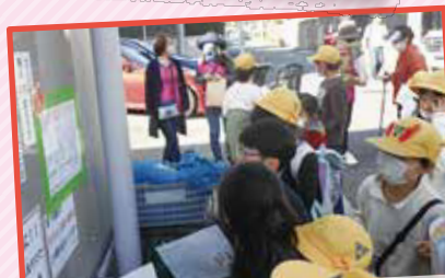
しやうがっこうせいしやうねんけんぜんいくせいしやうけんどうきやうかい ぎやうじ 小学校区青少年健全育成運動協議会の行事