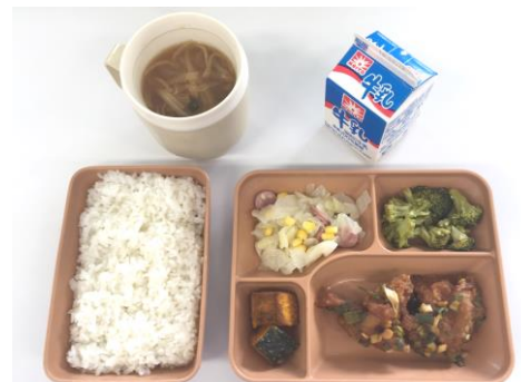
げんざい ちゅうがっこうきゅうしょく いちれい 現在の中学校給食の一例です。