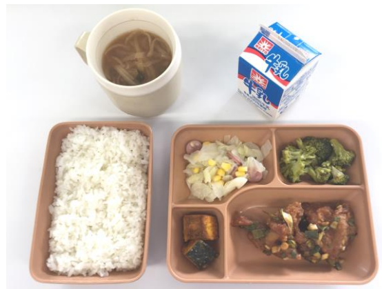
げんざい ちゅうがっこうきゅうしょく いちれい 現在の中学校給食の一例です。