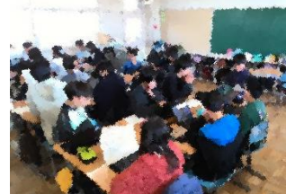
7～8人のグループで伝え合う