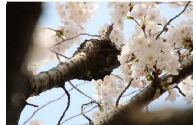
【常緑樹が覆い被さっているサクラ】