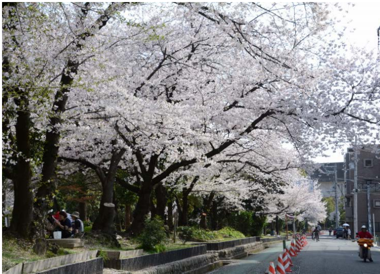
参加者の方オススメの道路側から見た桜

お花見の方々に、いつも以上に賑わっていた元茨木川緑地。私たちも調査をしながら、満開の桜を楽しみました。