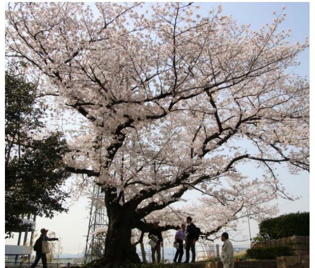
緑地の一番北の端にある古木