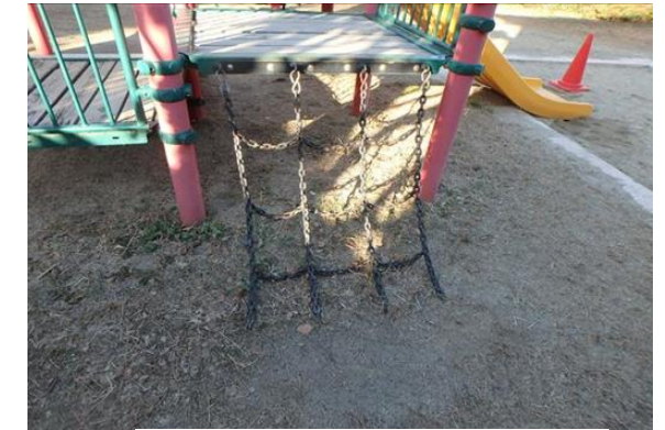
（遊具チェーン部の劣化）