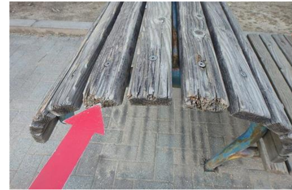
（ベンチ木部の腐食）