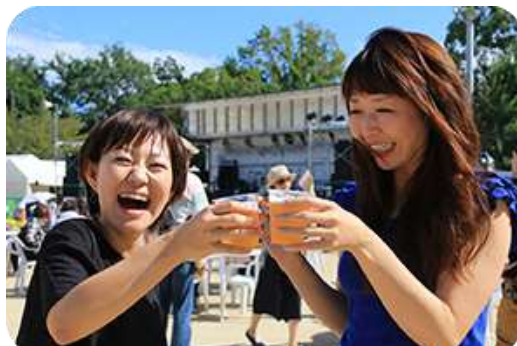
茨木麦音フェスト