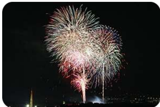
茨木辯天花火大会

まち全体に音楽が鳴り響く「茨木音楽祭」、夏の風物詩である「茨木フェスティバル」や花火大会、ビールと音楽の祭典「茨木麦音フェスト」など、食べて飲んで楽しめる魅力あるイベントが季節を問わず開催され、賑わいを見せています。