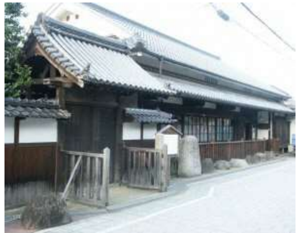
椿の本陣（郡山宿本陣）

平安時代に、市の中央部を東西に走る西国街道の往来がさかんとなり、江戸時代には参勤交代などに利用され、大名などが宿泊した「椿の本陣」は全国でも珍しい日本交通史上の遺跡です。