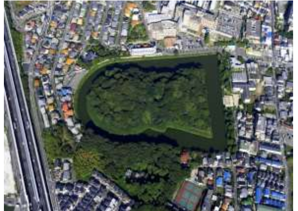
太田茶臼山古墳（継体天皇陵）

茨木市は日本でも有数の古墳群地帯で、古墳時代の初期から末期までの各時代の古墳が現存しています。