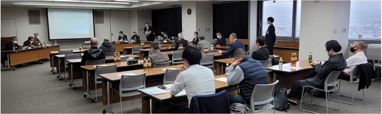
▲準備組合設立総会の様子

彩都東部地区 D 区域まちづくり協議会では、令和4年 1 月26日の準備組合設立に関するフジタからの提案を受け、準備組合を設立することについて同意取得を進めてきました。