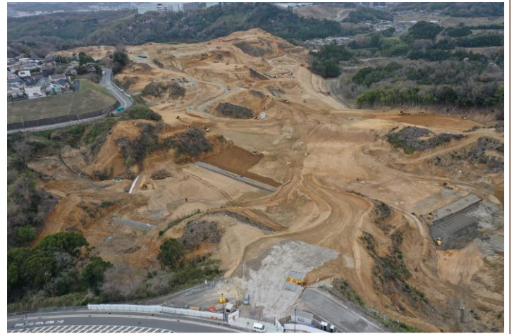
②南東から北西を眺望