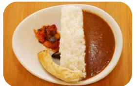
cafe D ver.

●イオンスタイル茨木・イオンスタイル新茨木 イオンスタイル茨木店:茨木市松ヶ本町8-30-3 イオンスタイル新茨木店:茨木市中津町18-1 営業時間/イオンスタイル茨木(食品):AM8:00~PM11:00 イオンスタイル新茨木(食品):AM7:00~PM11:00 (ダムカレーはAM11:00~PM1:00頃に販売) 定休日/なし 価格/734円