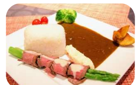
いばらき和牛倶楽部 ver.

●竜王山荘 kappo燈々庵 茨木市忍頂寺1049 営業時間/AM11:00~PM2:00 価格/1,100円 ※1日20食限定