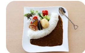
茨木市忍頂寺スポーツ公園竜王山荘 ver.2.0

●カストリーレストラン 茨木市船川五丁目5-5 MJビル2階 営業時間/AM11:30~PM2:30、 PM5:00~PM10:00 定休日/月曜日、火・水曜日は予約営業 価格/1,000円 ※予約推奨