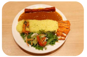
インドレストラン ガンジス ver.

●料理屋はなせ 茨木市上中条一丁目3-18 営業時間/AM11:30~PM2:00、PM6:00~ PM10:00 定休日/木曜日、ほか月に1、2回不定休 価格/1,980円 ※要予約