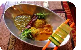
カストリーレストラン ver.

●カフェレカ 茨木市元町1-23 営業時間/日によって変動(詳細はSNSにて) 定休日/日・月曜日、祝日、ほか不定休あり