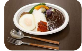
イオンスタイル茨木・イオンスタイル新茨木 ver.

●i cafe (アイカフェ) 茨木市西安威1-16-35 営業時間/AM11:30~PM5:00 定休日/月・火曜日 価格/1,100円(単品)、1,210円(セット) ※予約推奨