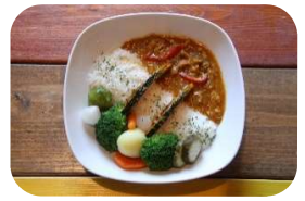
Mariana CAFE ver.

安威川ダムカレーをご注文の方には、安威川ダムカレーカードがもれなく付いてきます!