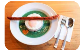
i cafe (アイカフェ) ver.

●MIYORICoffee 茨木市春日4-5-17 細川ビル1階 営業時間/AM6:00~PM2:30 定休日/月・火曜日、ほか不定休あり 価格/1,350円 ※1日5食限定