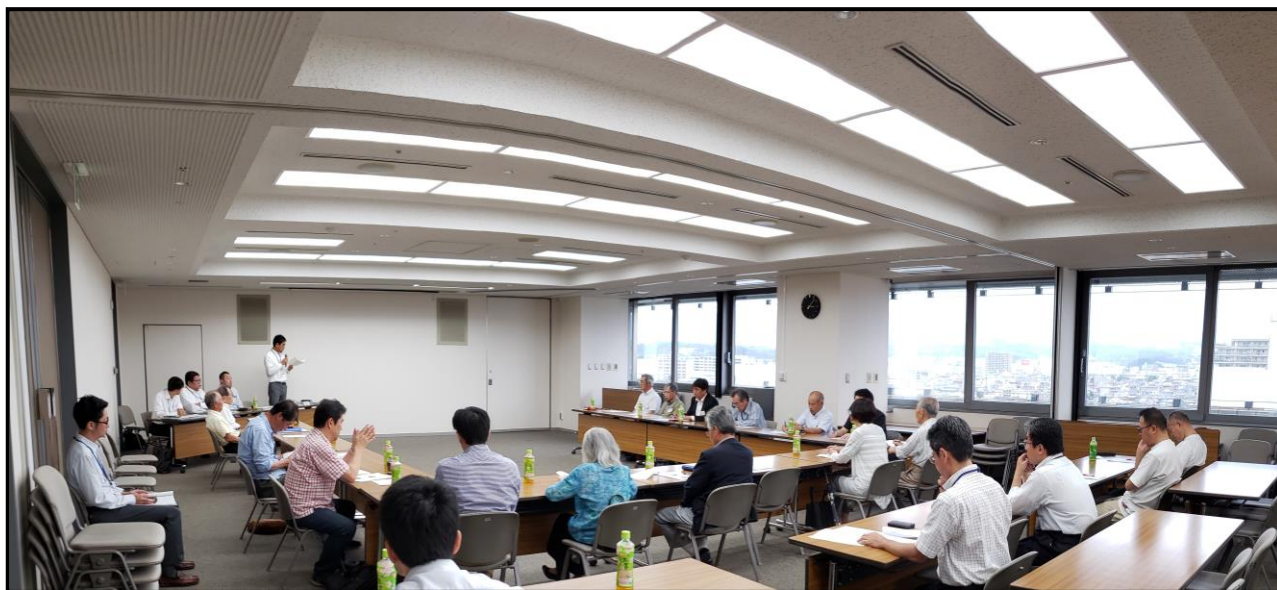
▲準備組合設立総会の様子

平成31年4月21日（日）のまちづくり協議会で説明させていただきました土地区画整理準備組合の設立に向け、同意取得を進めてきたところ、地権者皆様から38件の同意書をいただき、全体（44件）の約9割の同意を得ることができました。