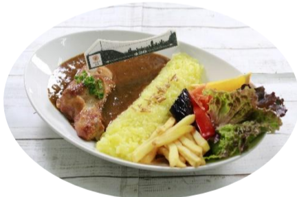
あいがわだむかれー