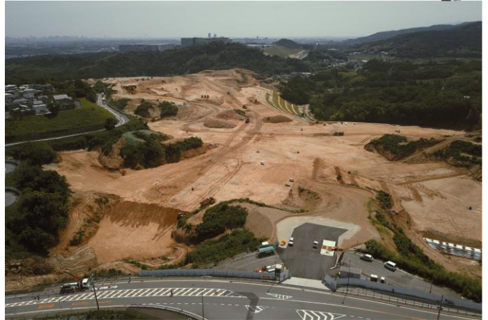
②南東から北西を眺望