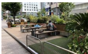
パークレットを活用し、歩道上に滞在空間を創出(神戸市)