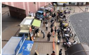
屋台出店や仮設の家具設置による賑わい空間の創出(門真市)