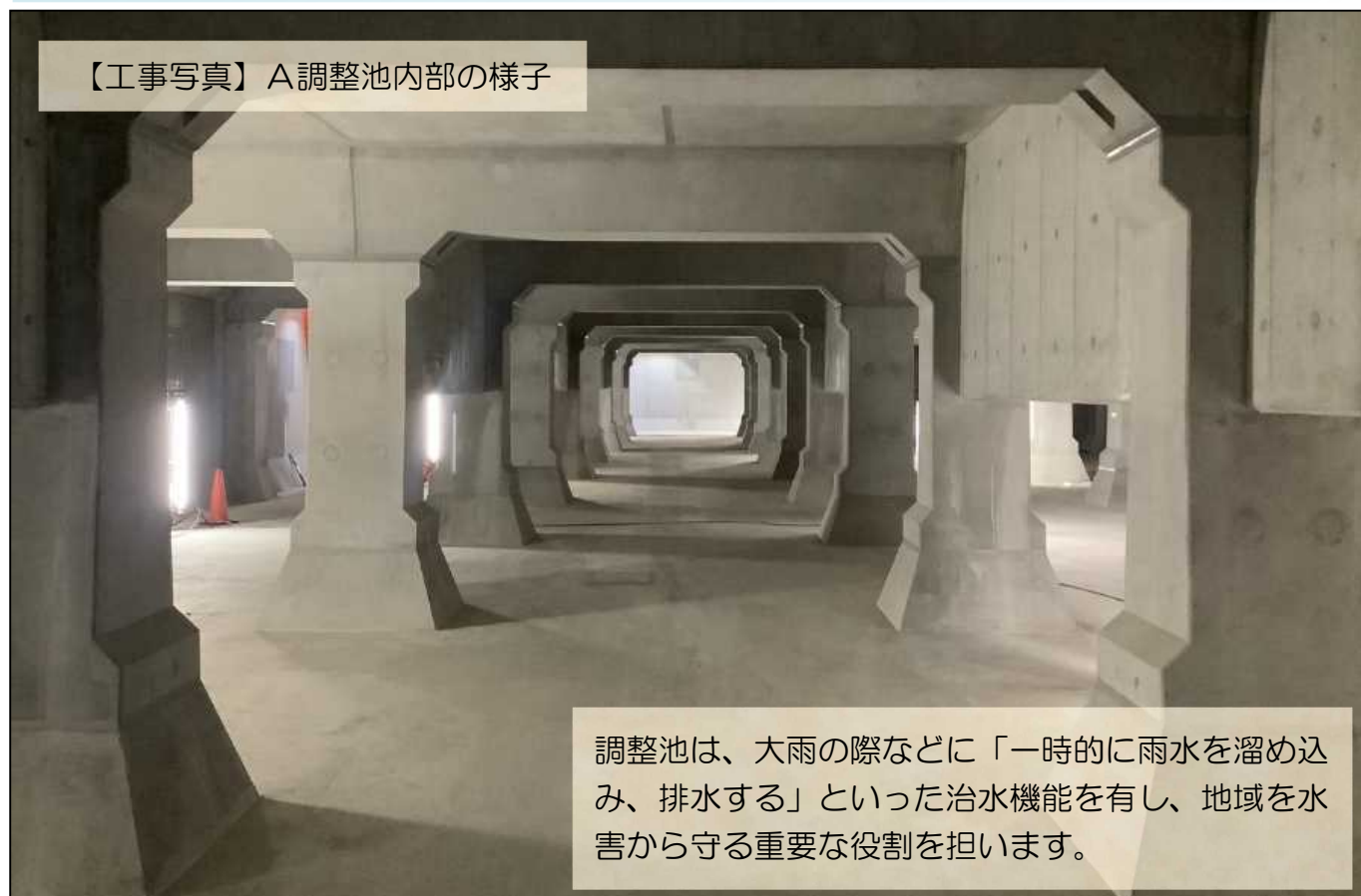
【工事写真】A調整池内部の様子

調整池は、大雨の際などに「一時的に雨水を溜め込み、排水する」といった治水機能を有し、地域を水害から守る重要な役割を担います。