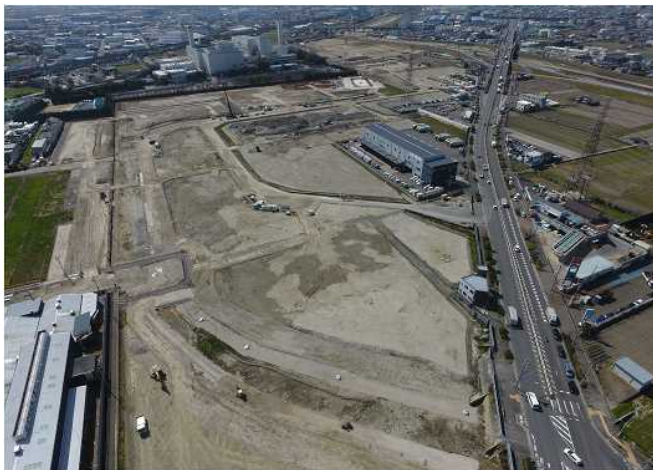
南目垣全景（区域北側より空撮）