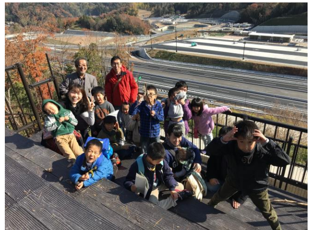
12 月 10 日に開通を控えた新名神高速道路と市内が一望できる展望台へ（天気が良かったので梅田のスカイビルも見えました。）