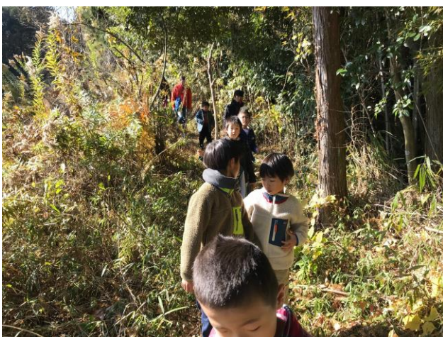
千提寺周辺を散策、険しい山道を越えてキリシタン史料館へ