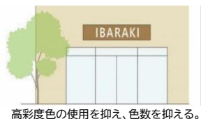
高彩度色の使用を抑え、色数を抑える。