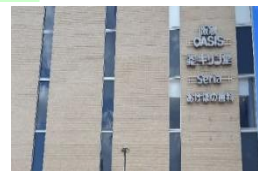
集約配置により効果的に情報を伝達する。