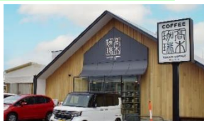
建物と一体的に計画する。