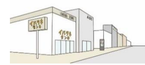
見通し景観に配慮する。