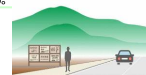
周囲の自然景観に調和した色彩や素材を使用する。