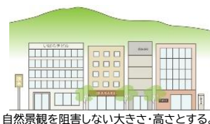
自然景観を阻害しない大きさ・高さとする。