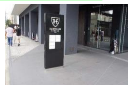
必要な情報を集約化する。