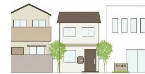
屋外広告物の掲出を控える。