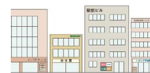
低層部への集約や規模を小さくしてまちなみの品格を高める。