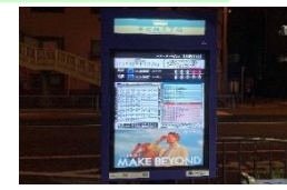
動画の使用を控え、輝度を抑える。