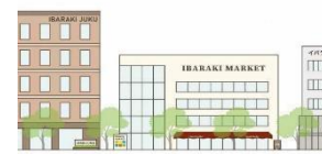
低層部への掲出により、賑わいの連続性を演出する。