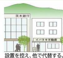
設置を控え、他で代替する。