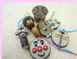
クラフト作品（イメージ）