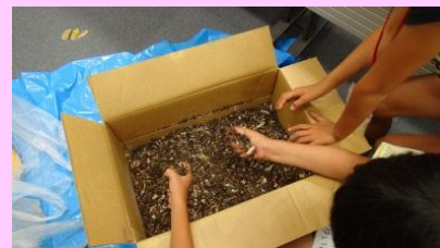
ダンボールコンポスト作成の様子（昨年度）