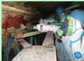
吹付け石綿の除去作業の様子

(KPI) ・ 事前調査結果の都道府県等への報告は、原則として電子システムによるものとする。 ・ 事前調査を行う一定の知見を有する者について、3年程度で30万人~40万人程度の育成に向け取り組む。