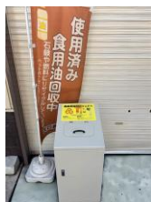
(株)大口油脂 工場前 (蔵垣内1丁目2-17)