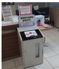
イオンモール茨木 1階 インフォメーション横