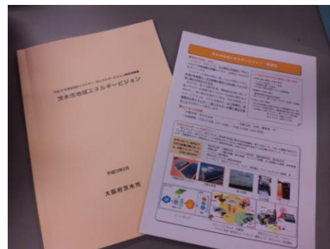
茨木市地域エネルギービジョン

これら重点プロジェクトによる取り組みを着実に進め、新エネルギー・省エネルギーの導入及び普及促進を図ることを本計画の目標としています。なお計画期間である平成32(2020)年度に向けての目標値は、「茨木市地球温暖化対策実行計画」において設定しています。