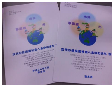
茨木市地球温暖化対策実行計画