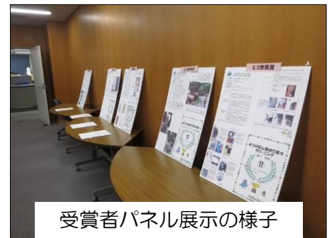
受賞者パネル展示の様子