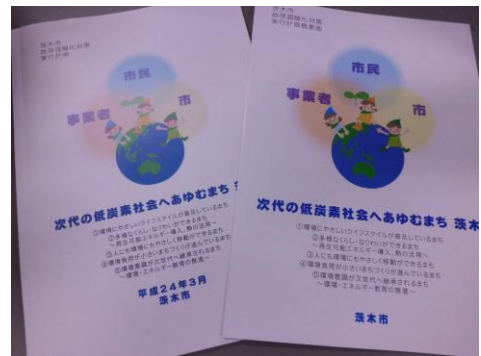
茨木市地球温暖化対策実行計画

平成20(2008)年6月に改正された「地球温暖化対策の推進に関する法律(温対法)」に基づき、茨木市にも、地域の自然的、社会的な条件に応じた温室効果ガス排出削減のための施策も含めた、実行計画の策定が義務付けられました。本市では、市民・事業者・市など、市内のあらゆる主体が率先して、地域の特性を踏まえた温室効果ガス排出量削減を、総合的かつ計画的に実施するため、平成24(2012)年3月に「茨木市地球温暖化対策実行計画～次代の低炭素社会へあゆむまち 茨木～」を策定しました。