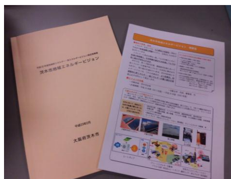
茨木市地域エネルギービジョン

これら重点プロジェクトによる取り組みを着実に進め、新エネルギー・省エネルギーの導入及び普及促進を図ることを本計画の目標としています。なお計画期間である平成32(2020)年度に向けての目標値は、「茨木市地球温暖化対策実行計画」において設定しています。