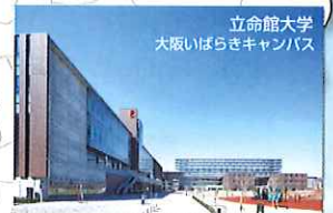
立命館大学 大阪いばらきキャンパス