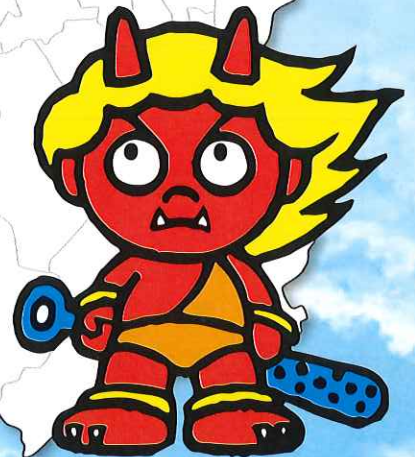
茨木市観光特任大使 いばらき童子