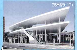
茨木駅 (JR) JR、阪急電鉄、大阪モノレールの 駅が計11駅あります。