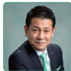
八尾市長 大松桂石氏