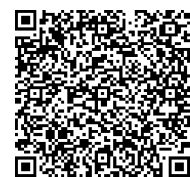
各予防接種の詳細

詳細は茨木市のホームページをご覧ください。茨木市立こども支援センターにお問い合わせください。