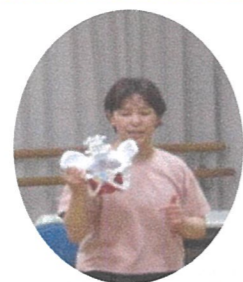
ひめトレ棒で骨盤周辺を鍛えます

女性の体の機能や仕組み等についての学びもあり、参加者は熱心に受講され、アットホームな雰囲気の中で和やかな交流会でした。