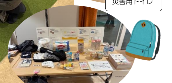
小さなこどもがいる時の避難時に必要なもの