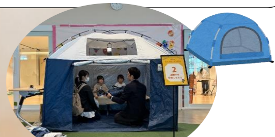
茨木市で備えている避難テントとベッド