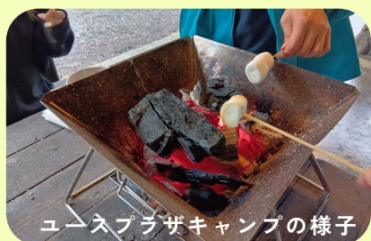
ユースプラザキャンプの様子

☎ 070-1513-3453 (9:00~21:00) 日曜・火曜・祝日・年末年始休み