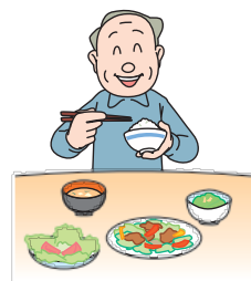
十分な休養と バランスのとれた栄養