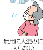
無用 に人混み に入らない