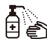
手指消毒用アルコール による消毒の励行

新型コロナワクチンの有効性・安全性などの詳しい情報については、厚生労働省ホームページの「新型コロナワクチンについて」のページをご覧ください。