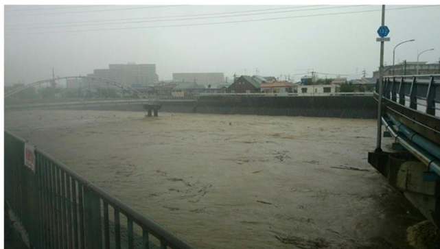
安威川増水時の様子