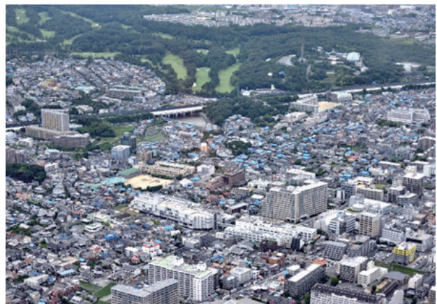
松ヶ本町・下穂積一～四丁目・中穂積二・三丁目