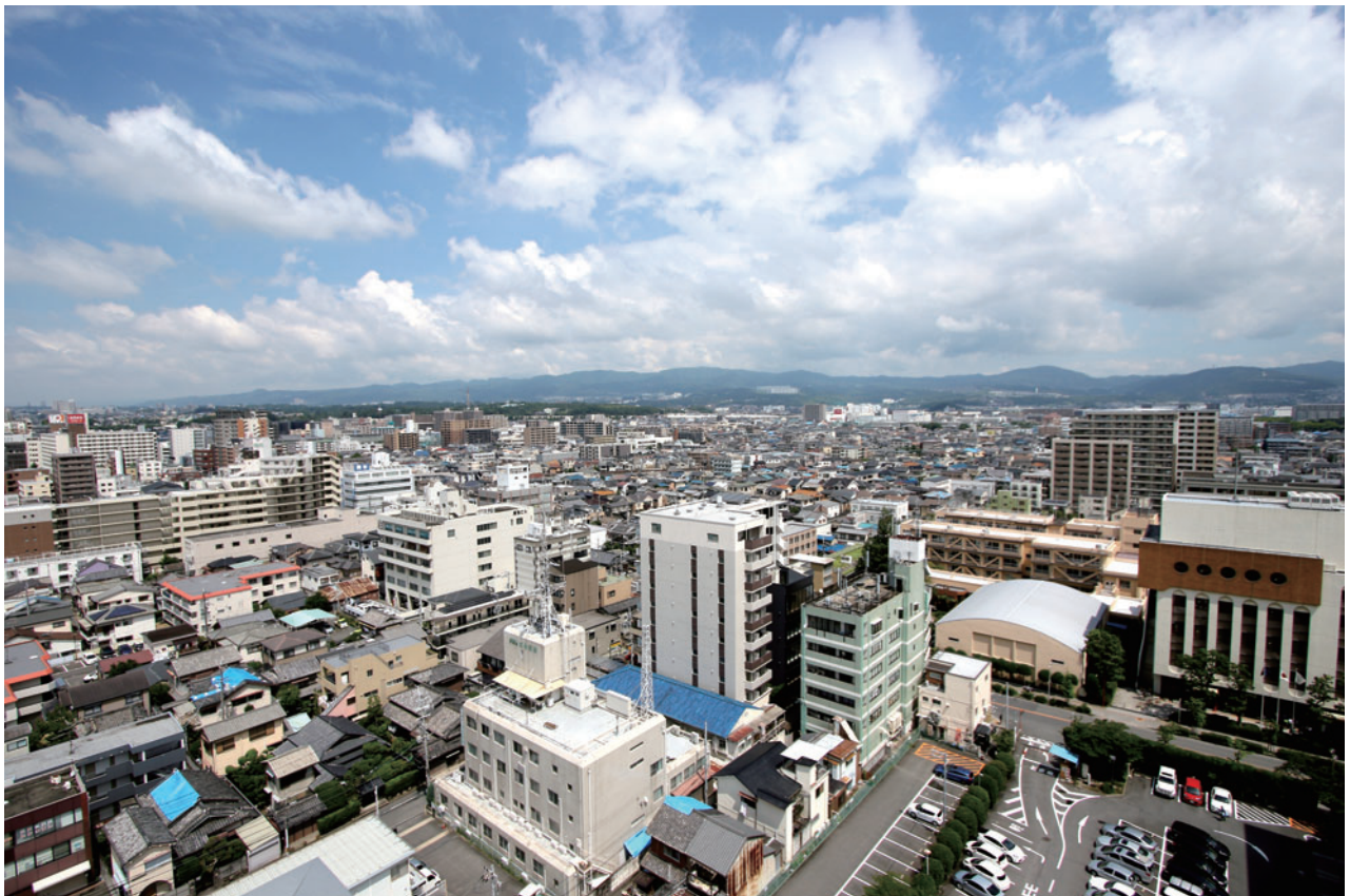
市内の様子（平成30年6月撮影）

市では、市内の全75指定避難所を開設し、最大時750人の市民が避難した。大きな被害を受けた家屋は限定的で、一見すると大きな被害のない災害に見えたが、被災した家財の撤去をはじめさまざまな支援を要する世帯が多く、きめ細やかな支援が必要とされた。市では、全国から多くの人的・物的支援を受け、災害対応や被災者への支援を展開するとともに、高齢者など、日常生活への復帰に不安を感じる市民の方々にも対応するため、最長8月4日まで避難所開設をしながら、被災者支援に努めた。