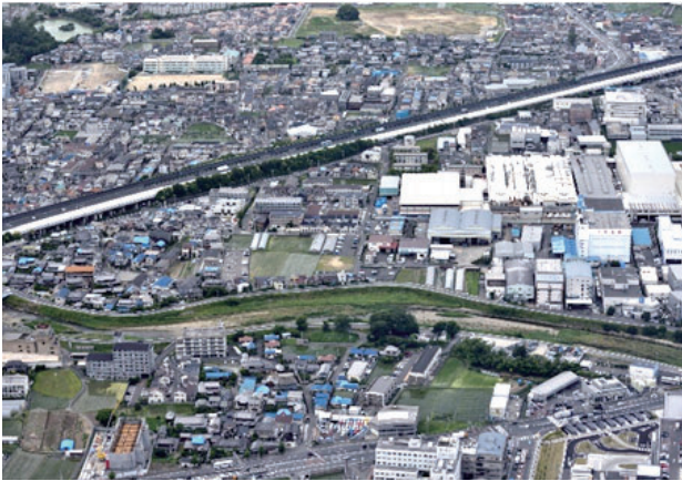
上野町・五日市一・二丁目・畑田町