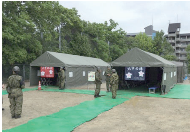
自衛隊による入浴支援