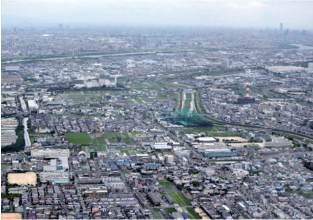
鮎川一～五丁目・学園南町・白川一丁目・新堂一～三丁目