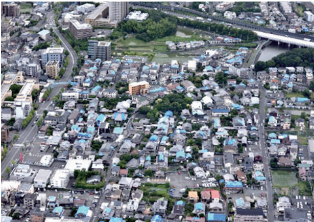
中穂積二・三丁目