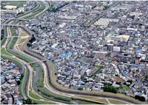
中村町・寺田町・中津町・五十鈴町