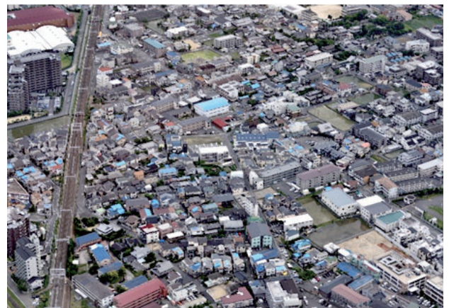
大正町・丑寅二丁目・蔵垣内二・三丁目