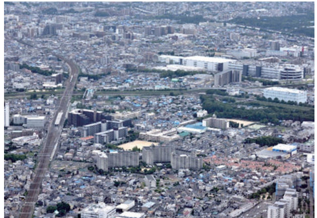
三島丘一・二丁目・三島町