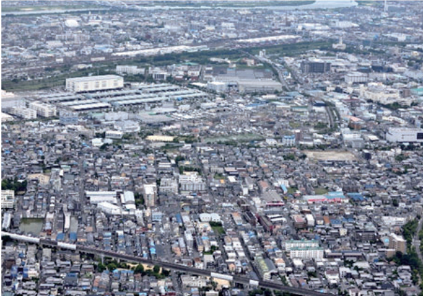
沢良宜東町・沢良宜浜一～三丁目・島一～四丁目・宮島二丁目