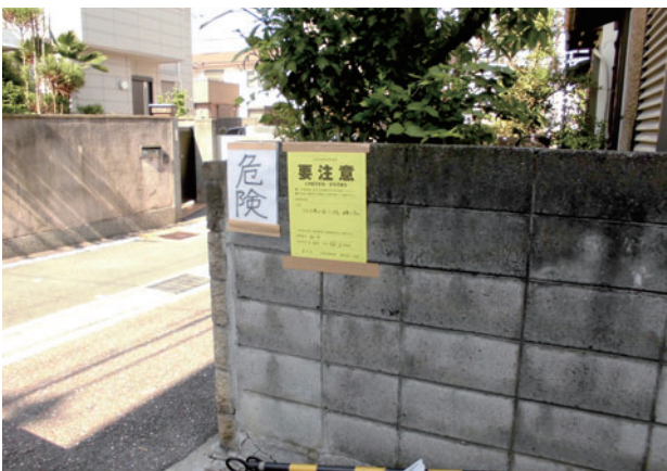
危険度判定の結果の表示