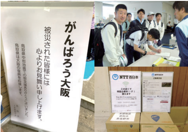
いただいた様々な支援