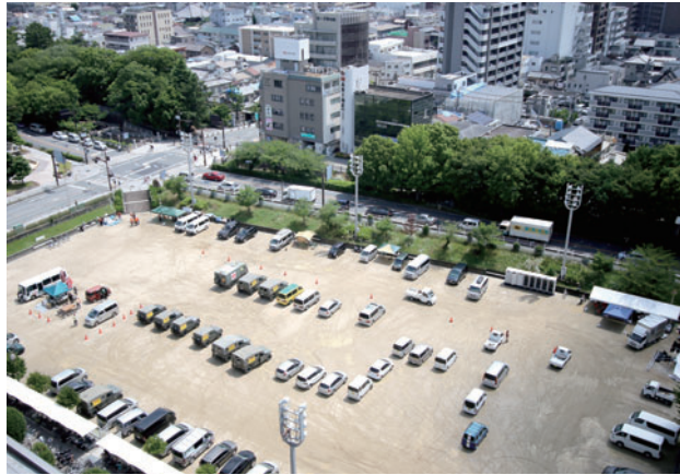
市役所付近に集結した関係機関の車両