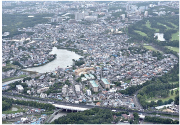
北春日丘一～四丁目・南春日丘二丁目～七丁目