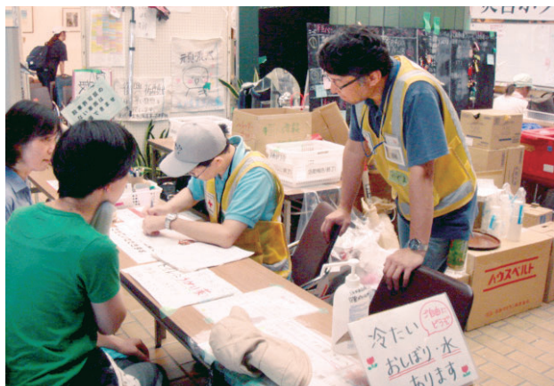
ボランティアの受付