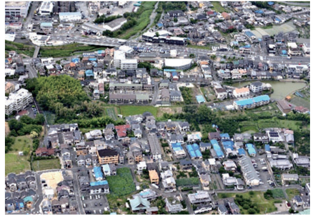
宿川原町・郡山二丁目・豊原町・下井町