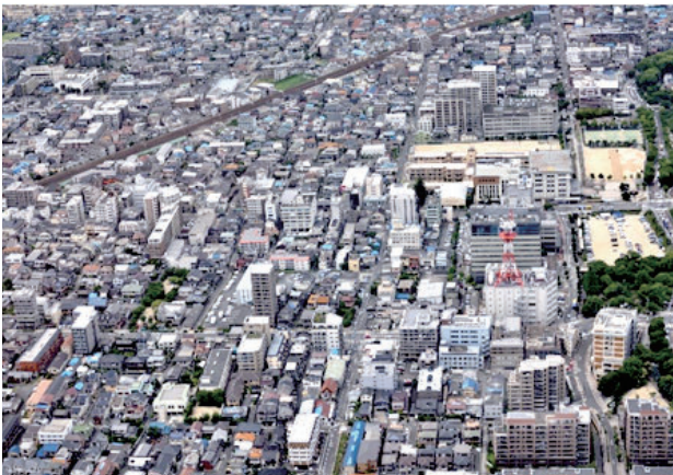
駅前一～四丁目・下中条町・東中条町