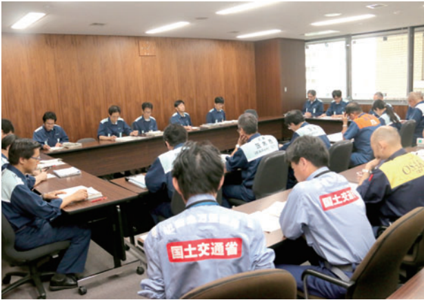
市の災害対策本部会議