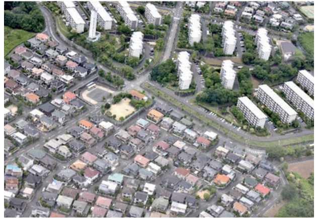
山手台一・二丁目