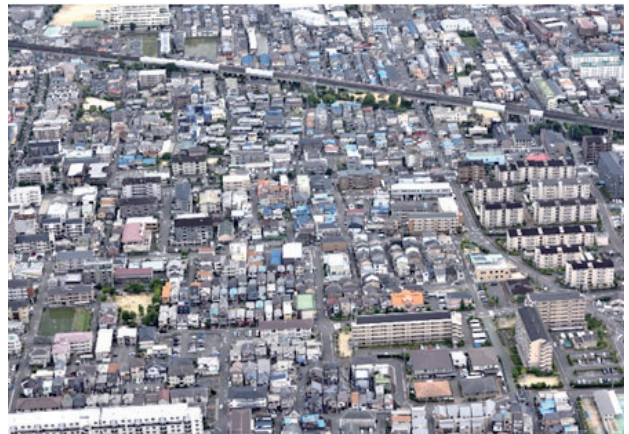
玉櫛一・二丁目・真砂一・二丁目