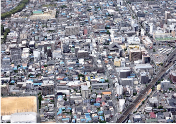
元町・大手町・新庄町・別院町