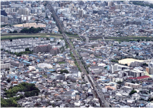
総持寺駅前町・中総持寺町・橋の内二丁目・庄二丁目