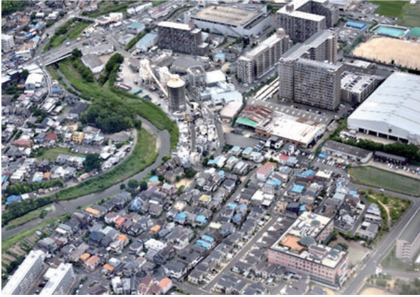
西福井二丁目・中河原町