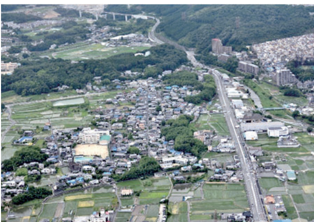
安威一～四丁目・東安威一・二丁目