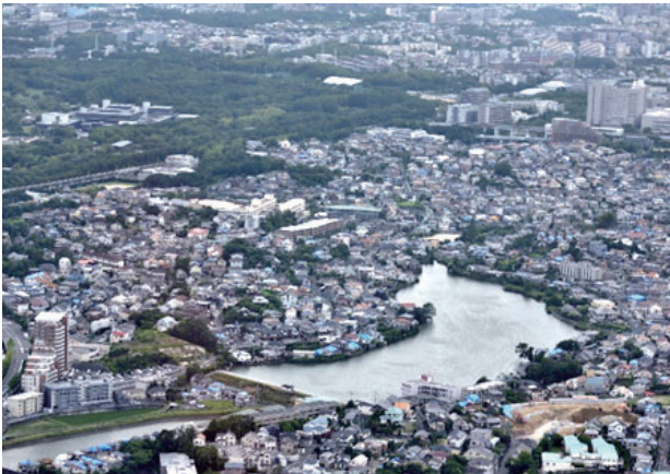
北春日丘一～三丁目・南春日丘一～七丁目