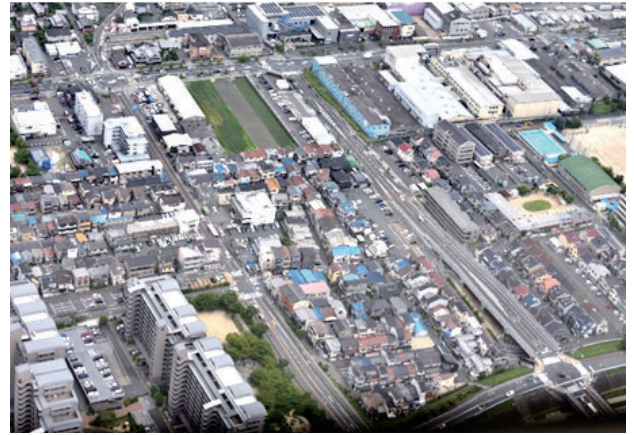
学園町・学園南町