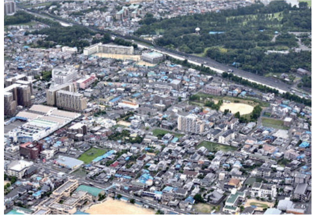
見付山一・二丁目・上穂積一～三丁目・上穂東町付近