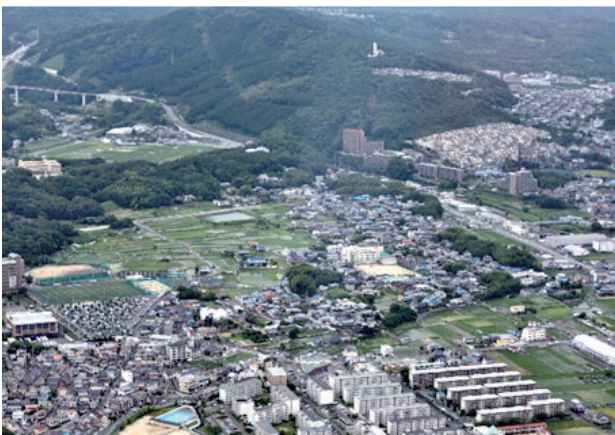
南安威二・三丁目付近