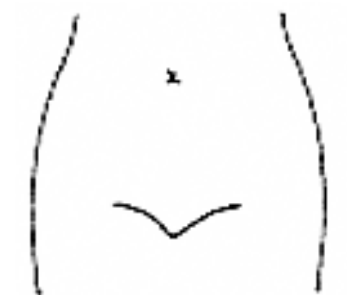
(腸瘻 ろう 及びびらんの部位等を図示)