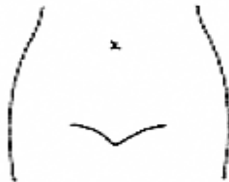
(ストマ及びびらんの部位等を図示)