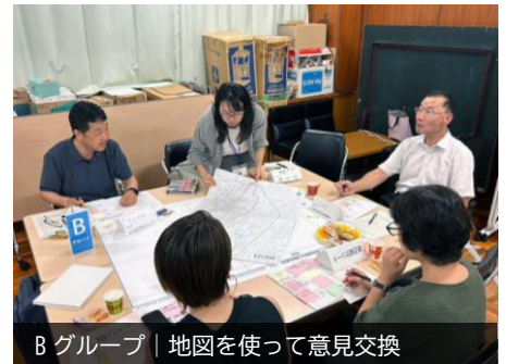
Bグループ | 地図を使って意見交換