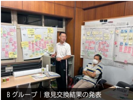
Bグループ | 意見交換結果の発表