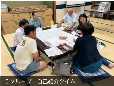
Cグループ | 自己紹介タイム