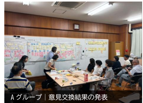
Aグループ | 意見交換結果の発表