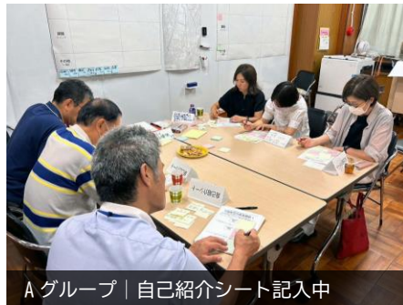
Aグループ | 自己紹介シート記入中