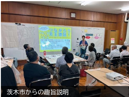
茨木市からの趣旨説明

「利便性と交通」の良い面は、交通の便が良いことで、逆に課題は、渋滞や交通安全、買い物が不便なことで、登校時の危険箇所や渋滞箇所については地図上で確認しました。「地域活動」の良い面は、活動的な人がいて、地域活動が活発なことや小学校との連携が良いこと、逆に課題は、担い手不足や活力が低下しつつあることで、イベントを活性化したいとの意見もありました。他、公園やみどり、遊び場が少ないとの指摘もありました。