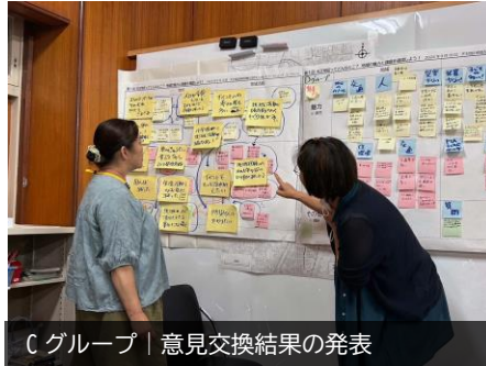
Cグループ | 意見交換結果の発表