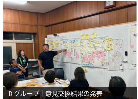
Dグループ | 意見交換結果の発表