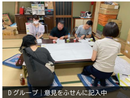
Dグループ | 意見をふせんに記入中