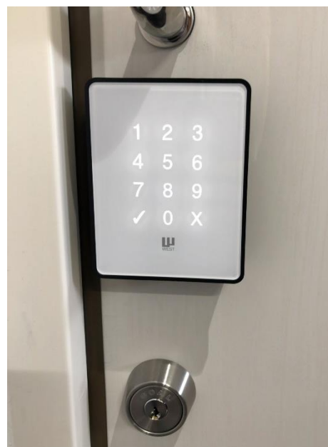
貸室に設置されるスマートロック (RemoteLOCK 8j)