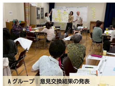
A グループ | 意見交換結果の発表