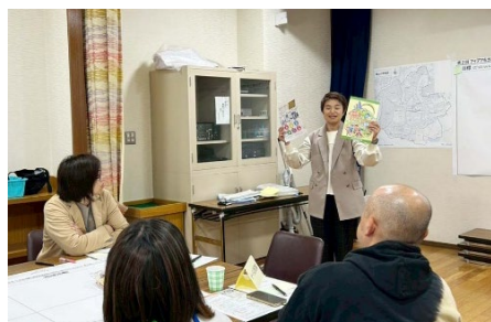
市より自治会加入促進事例の紹介

また、ワークショップ後のアンケートでは、「問題点から具体策へと話が進んでよかった」などの意見があり、連続ワークショップで議論が掘り下げられ、今後のまちづくりの方向性が共有されました。