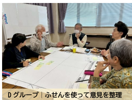
D グループ | ふせんを使って意見を整理