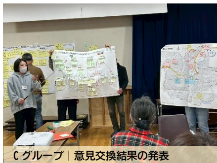
C グループ | 意見交換結果の発表