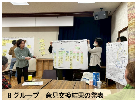
B グループ | 意見交換結果の発表