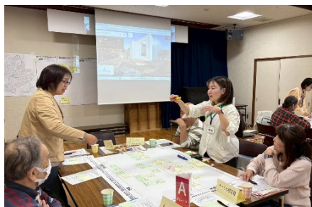
A グループ | ふせんを使って意見を整理