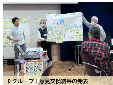
D グループ | 意見交換結果の発表