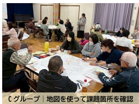
C グループ | 地図を使って課題箇所を確認