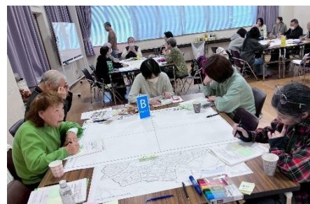
B グループ | ふせんを使って意見交換