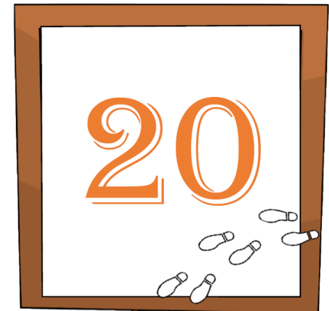
使用したポイント用紙