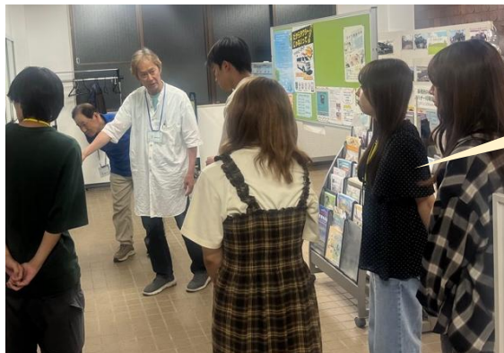
コミュニティセンター 見学の様子