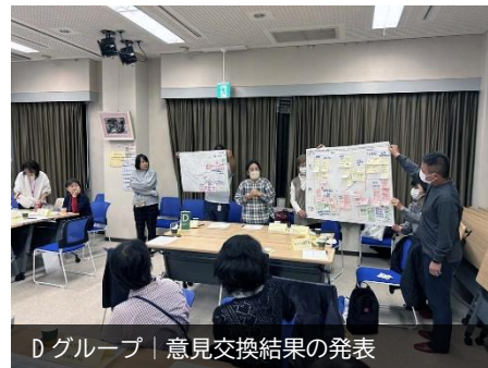
Dグループ | 意見交換結果の発表