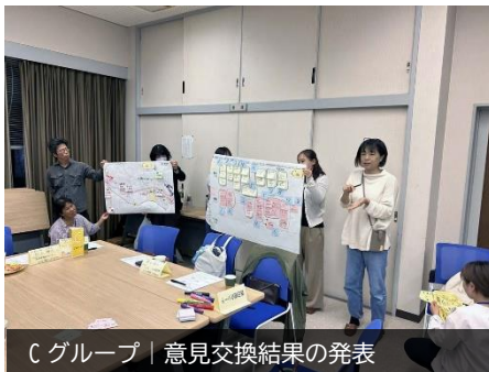
Cグループ | 意見交換結果の発表