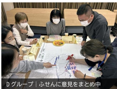
Dグループ | ふせんに意見をまとめ中