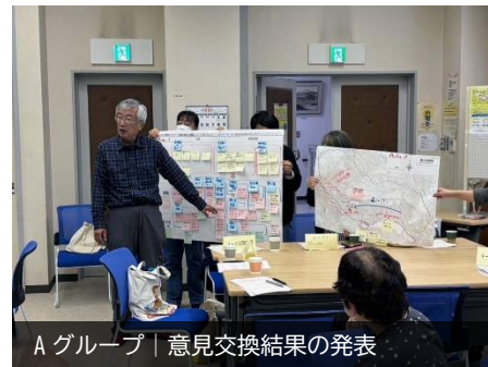
Aグループ | 意見交換結果の発表