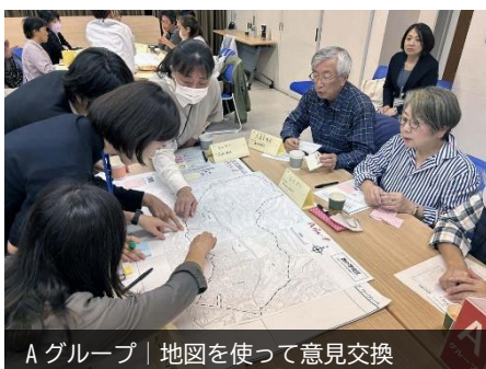
Aグループ | 地図を使って意見交換