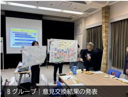
Bグループ | 意見交換結果の発表