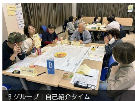
Bグループ | 自己紹介タイム