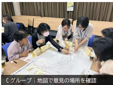
Cグループ | 地図で意見の場所を確認