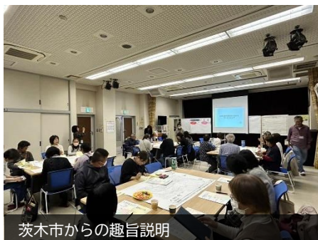
茨木市からの趣旨説明

次回は12月22日(日)に、今回の意見をもとに、「地域をより良くするには?地域のこと、担い手のこと、話し合しましょう」をテーマに、今後の地域と地域活動のあり方について話し合いを深めます。