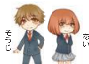
中学生もたくさんトラブルに巻き込まれているんやね。