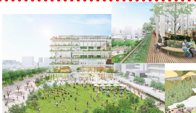
おにクル整備のイメージ