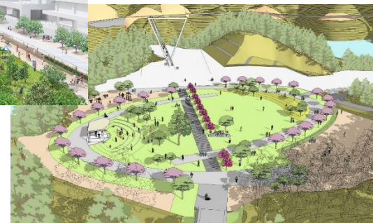
安威川ダム周辺整備のイメージ