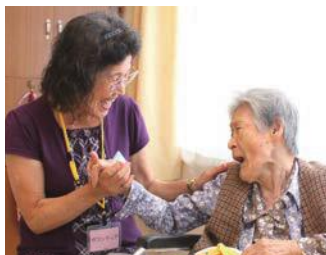
「話し相手」ボランティアの様子

高齢者の活躍の場を広げるため、高齢者のいきがい等につながるシニアいきいき活動ポイントの対象施設等を拡充する。(328万円)