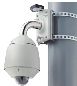
カメラ設置イメージ

安全・安心なまちづくりを推進するため、市内小学校の通学路に防犯カメラを設置する。(759万円)