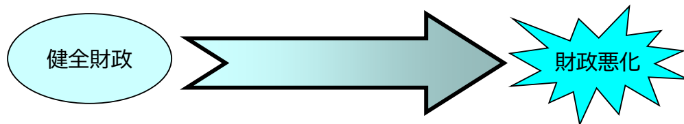
《公営企業会計の経営健全化基準のイメージ》