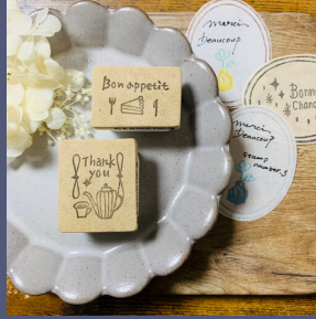
stamp number.3 消しゴムはんこ