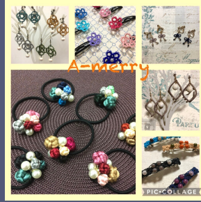
A-merry 中国結アクセサリー