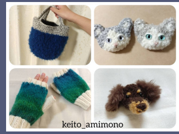
keito_amimono どうぶつブローチ・ニット小物