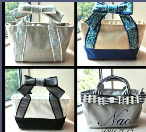
NAO 帆布バッグ・布小物