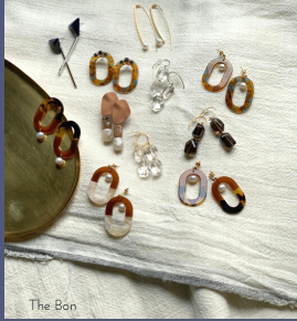
The Bon アクセサリー・布小物