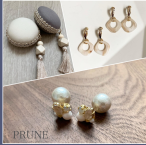
PRUNE アクセサリー・マカロンメジャー