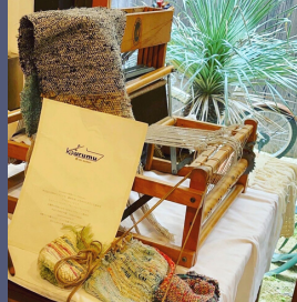
Vin button アップサイクル製品