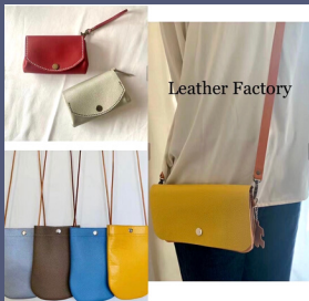
Leather Factory 皮革製品