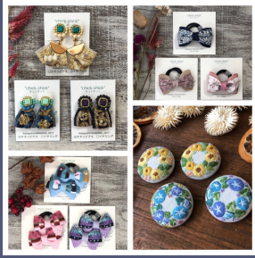
chick chick 刺繍アクセサリー・布小物